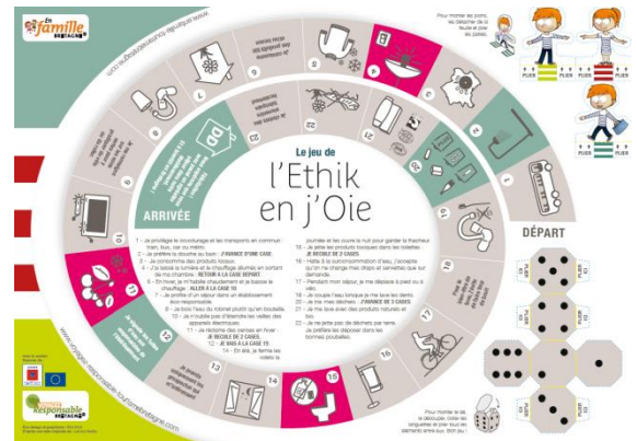
Jeu de l'oie